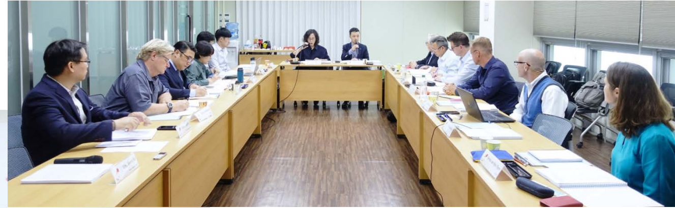
1st Meeting of the Independent Advisory Committee for Wetland City Accreditation of the Ramsar Convention 25-27 September 2019 Suncheon City, Republic of Korea